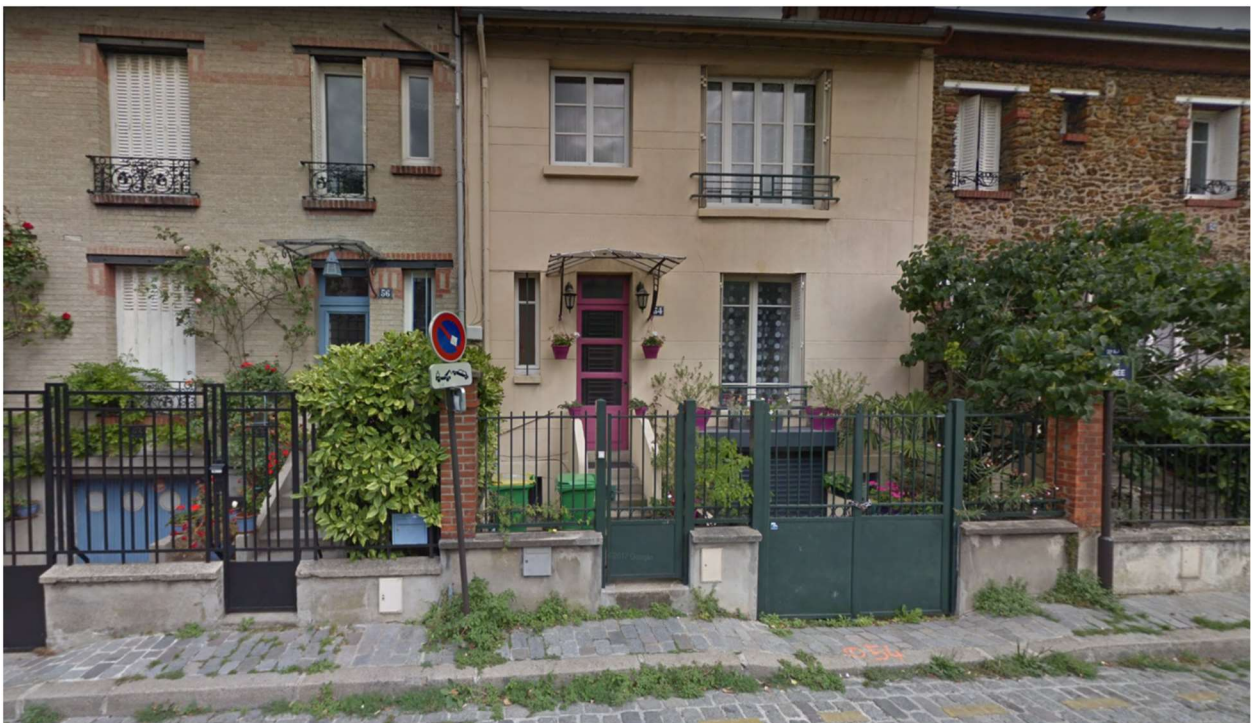
Rue Jules Siegfried, Paris