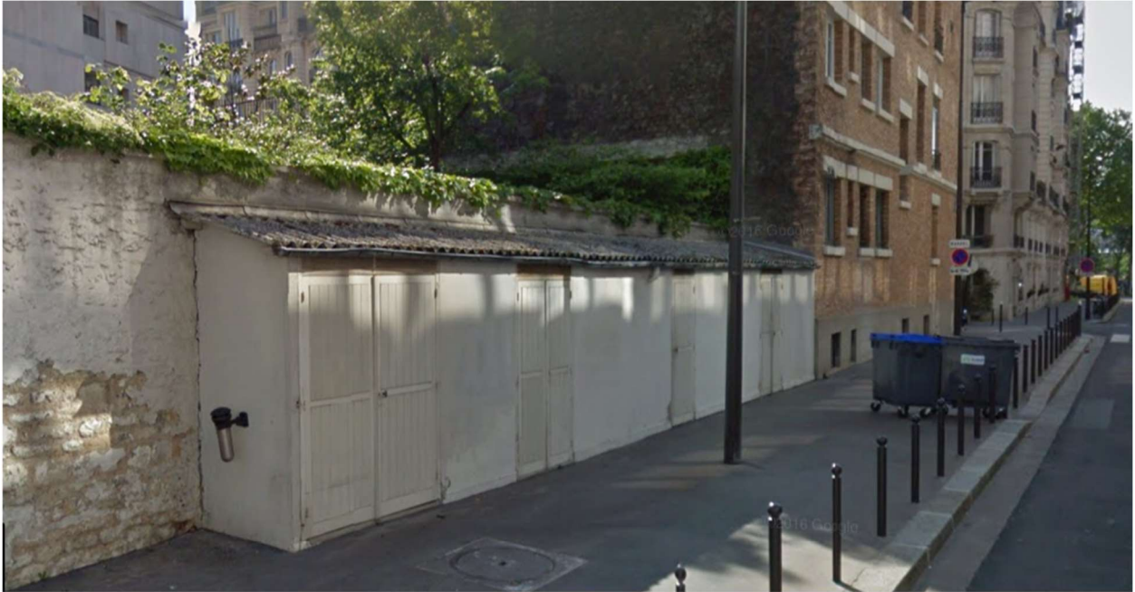
Rue Mario Nikis, Paris